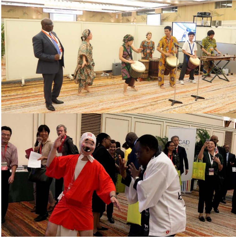
(TICAD閣僚会合における鹿児島県三島村（ジャンベ演奏）、 宮崎県日向市（ひよっこ踊り）のパフォーマンス 2018年10月)