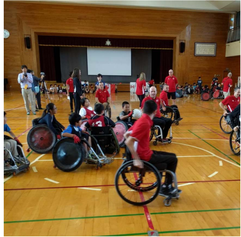
(青森県三沢市でカナダ車いすラグビーチームの受入れ 2018年10月)